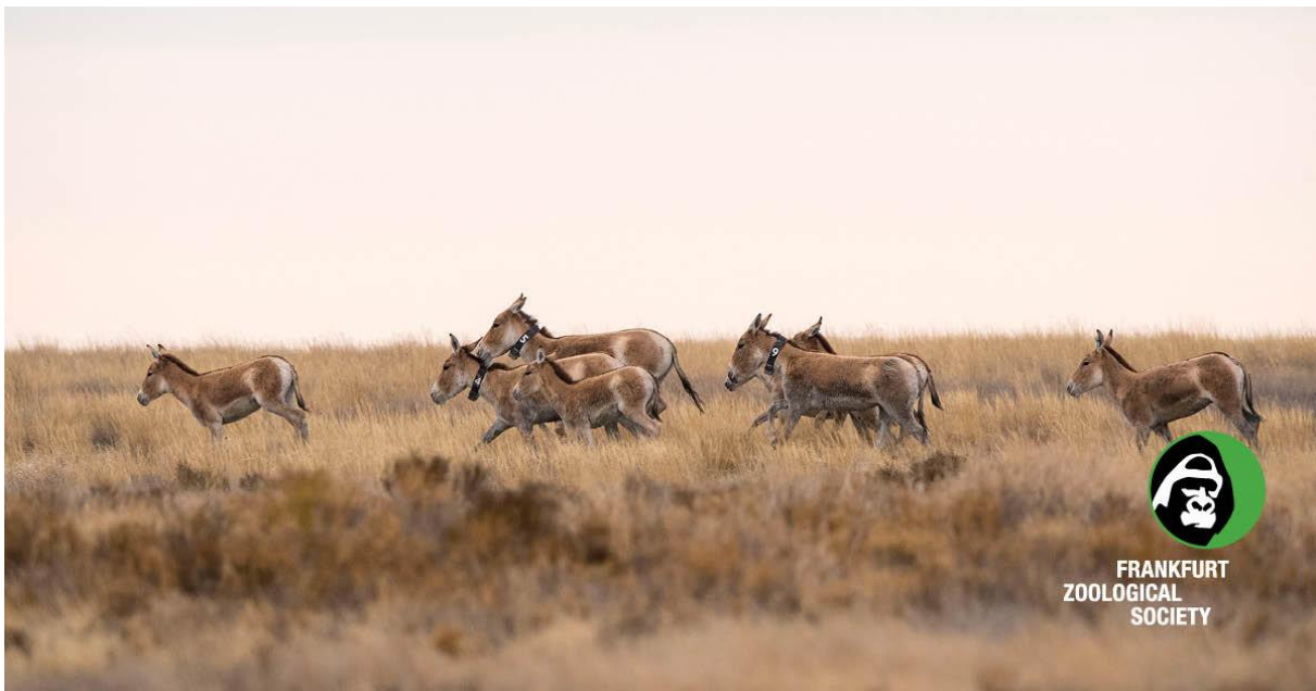
Eine kleine Herde Wildesel (auch „Kulane“ genannt) in der kasachischen Steppe

Frankfurt 17.11.2021 – Die Frankfurter Fondsboutique CHOM CAPITAL unterstützt die Zoologische Gesellschaft Frankfurt („ZGF“). Als Teil des Bekenntnisses, 10% der Fondsumsätze des CHOM CAPITAL PURE Sustainability – Small Cap Europe UI in ökologische und soziale Projekte zu spenden, unterstützt CHOM CAPITAL das Projekt „Wiederansiedlung von Wildeseln in der kasachischen Steppe“ mit einer Summe von 5.000 EUR. Hiermit leisten die Frankfurter Aktienspezialisten einen Beitrag zur Verbesserung der Artenvielfalt in der kasachischen Steppe Altyn Dala und tragen zum Erbe des berühmten Tierschützers Bernhard Grzimek bei, der die ZGF von 1958 an stark geprägt hat.